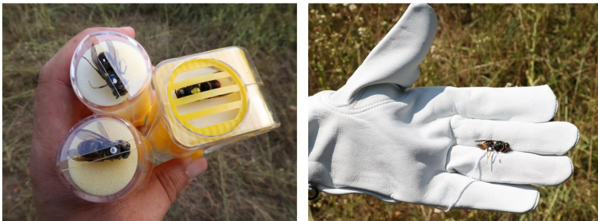
Abbildung 3: Individuell markierte Individuen (links) und eine zuvor mittels Eis oder Kühlakkus ruhig gestellte Hornisse zur Befestigung des beschwerenden Bindfadens (rechts), © AGES/Schorkopf

WICHTIG: Beim ersten Abflug von einem ihm unbekanntem Locktopf wird das Tier mehrfach um die Futterstelle kreisen, um sich zu orientieren. Diese Flüge eignen sich NICHT zur Richtungs- und Flugdauerbestimmung.