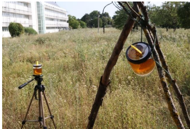
Abbildung 4: Locktöpfe auf offener Fläche mit guter Weitsicht aufgestellt. Vorderer Locktopf: hängende Vorrichtung mit zusammengebundenen Stecken. Hinterer Locktopf: gekauftes Stativ.