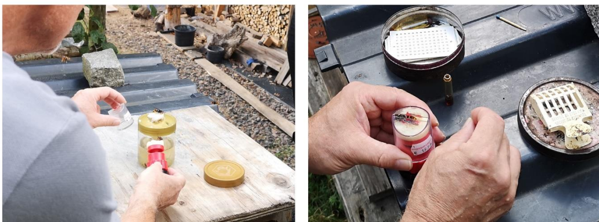
Abbildung 2: Mit ruhiger Hand gelingt das Einfangen von Tieren mittels Zeichnungskäfig direkt vom Locktopf (links), danach können diese individuell markiert werden (rechts), © AGES/Schorkopf

Eine erfolgreiche Nestsuche kann in vielen Fällen durch eine Person durchgeführt werden, es ist aber empfehlenswert die hier dargestellten Methoden mit mindestens 2–3 Personen durchzuführen. Die Suche gestaltet sich dann schneller und effizienter, besonders bemerkbar bei schon eingespielten Gruppen. Besonders bei Missgeschicken oder unvorhersehbaren Ereignissen ist man in der Gruppe auch flexibler. Die hier vorliegenden Beschreibungen von aufeinander folgenden Vorgängen sollte jedoch an örtliche Gegebenheiten, Flugaktivitäten der Hornissen und mögliche Teamgrößen angepasst werden. Bleiben Sie flexibel und offen im Denken!