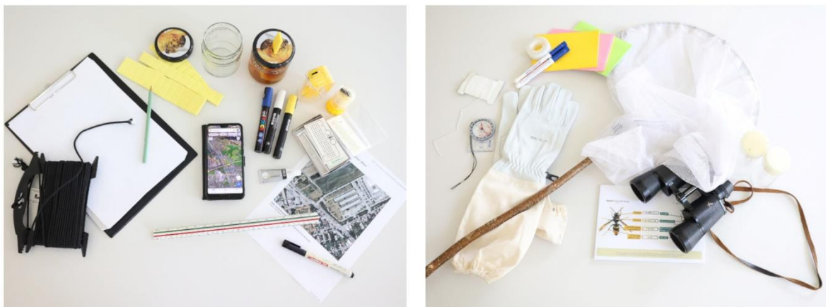
Abbildung 1: Übersicht über unbedingt notwendige (links) und weitere praktische Materialien (rechts). Ständer und Aufhängevorrichtungen nicht abgebildet.